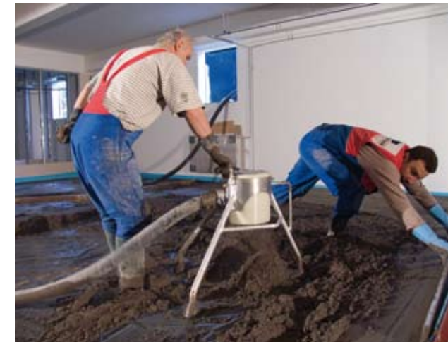
Миксокрет самые различные материалы. Смесь для бесшовных полов + песок с фракцией 8 мм, ...