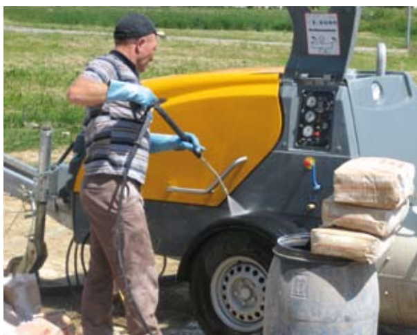
Опционально Миксокрет может быть оборудован мощным очистителем высокого давления.