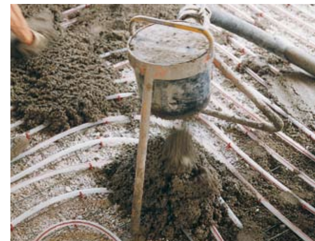
... щебень с фракцией до 16 мм (например, при керамзито-бетонной теплоизоляции),