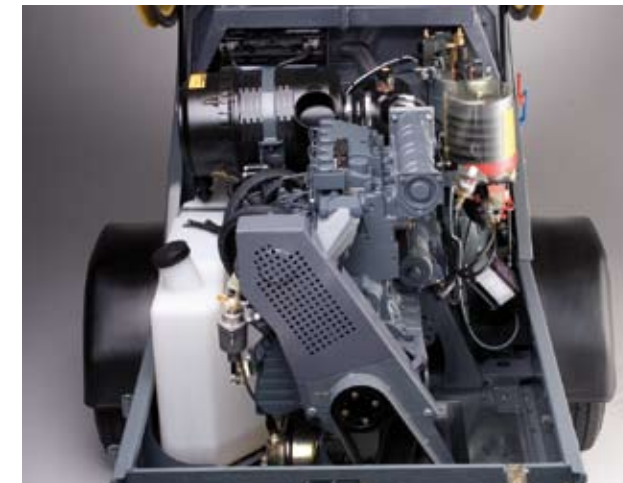
Новый дизельный двигатель располагается продольно с компрессором. Благодаря этому все легко доступно для обслуживания.