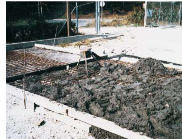
даже бетон с фракцией до 20 мм машина качает без проблем на большие расстояния.