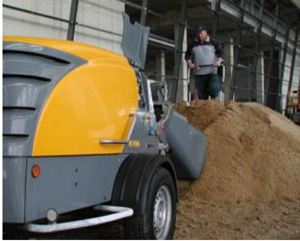
Новый Миксокрет - вариант со скипом и скраппером.