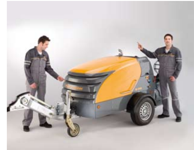
Благодаря разумной подаче воздуха, защищены и человек и машина. Спереди засасывается воздух без пыли и выдувается назад, отсекая пылевую зону.