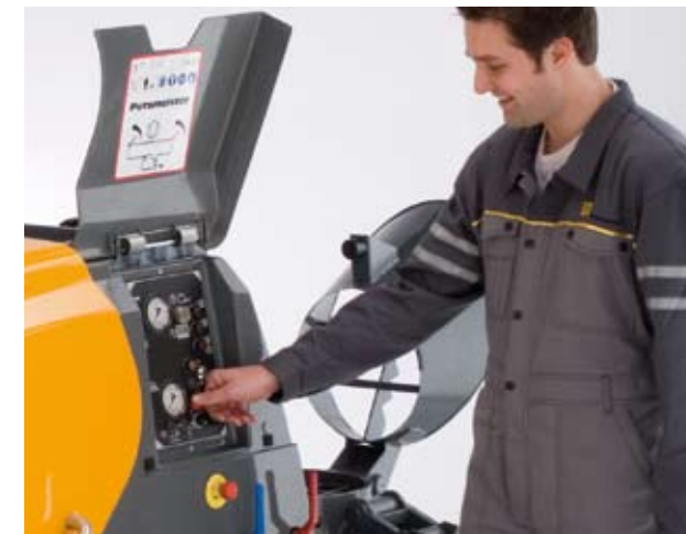
Панель управления очень удобна. В качестве защиты от загрязнений служит практичная и надежная крышка.