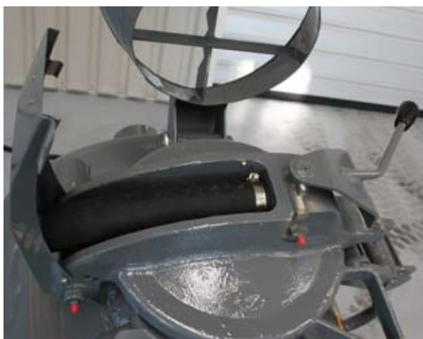
Большая загрузочная горловина смесительного бункера, простота и надежность в работе.